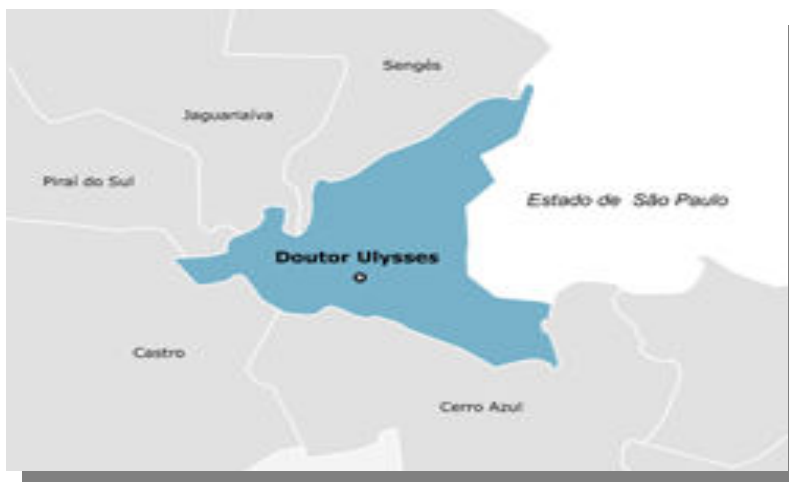
FIGURA 2 - DOUTOR ULYSSES - LIMITES GEOGRAFICOS

Tem seus limites geográficos com os municípios de Sengés, Jaguaíva, Piraí do Sul, Castro, Cerro Azul, e o Estado de São Paulo.